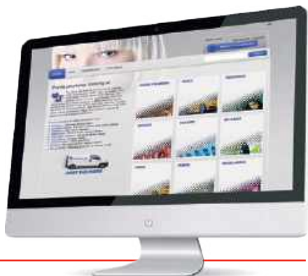
StoreFront web-to-print software

StoreFront es un servicio web-to-print integral diseñado para manejar los pedidos entrantes desde Internet. El procesamiento de pagos y la preparación de impresiones sin errores automatizados aseguran que los nuevos trabajos estén listos para imprimir en poco tiempo y con una mínima intervención del operador.