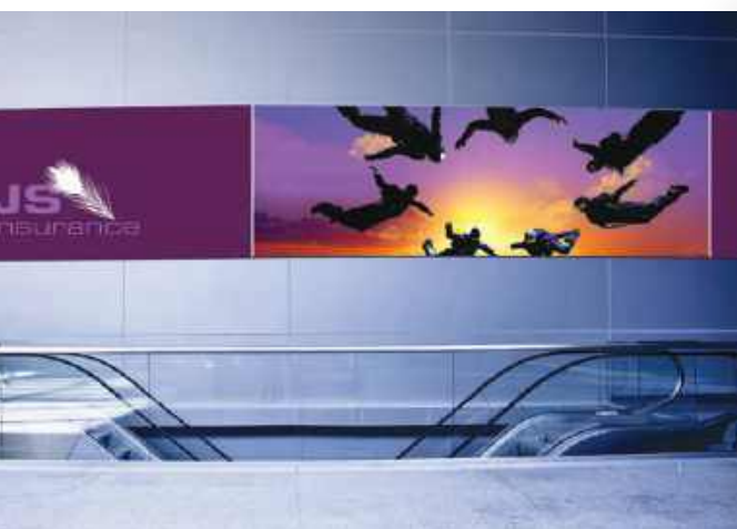
Comunicación en la tienda – forex

Al tratarse de una impresora altamente avanzada suministrada por Asanti, las Anapurna LEDs se integran perfectamente con PrintSphere, un servicio basado en la nube para la automatización de producción, intercambio de archivos sencillo y almacenamiento de datos seguro de Agfa Graphics. Este servicio en la nube integrable proporciona una forma estandarizada para que los proveedores de servicios de impresión automaticen su flujo de trabajo y se facilite el intercambio de datos con clientes, colegas, trabajadores independientes, otros departamentos y otras soluciones de Agfa.