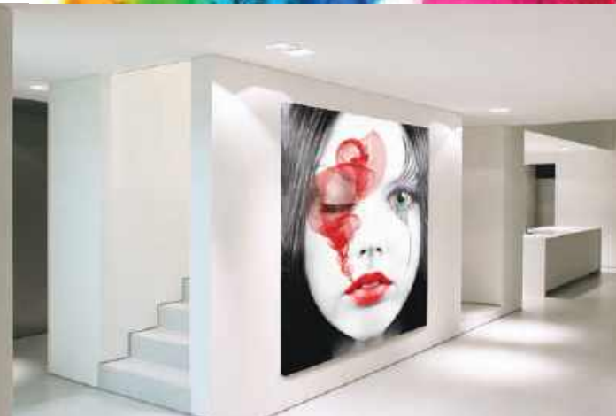
Decoración de interior – dibond