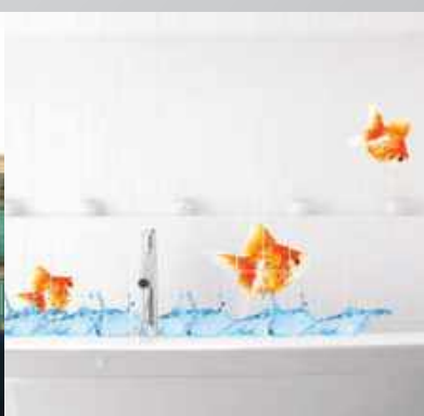
Impresión en azulejo