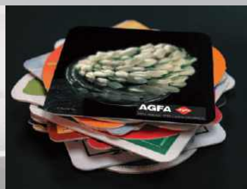
Impresión de objetos – cartón