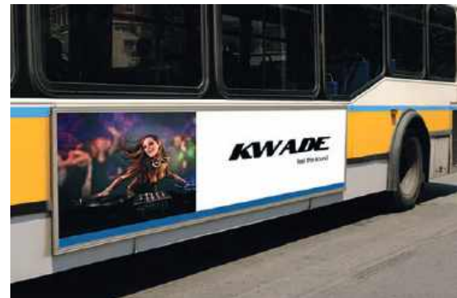
Comunicación exterior – vinilo