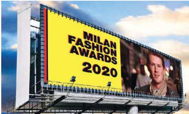
Comunicación exterior – vinilo