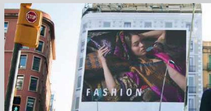
Comunicación exterior – vinilo