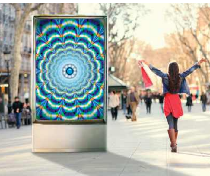
Outstanding print quality on backlit applications

La serie i híbrida de Anapurna con curado LED de gran formato es adecuada para talleres de cartelería, impresores digitales, laboratorios fotográficos e impresores serigráficos medianos que desean combinar trabajos de impresión de rígido y de rollo a rollo. Los equipos de 6 colores imprimen a un ancho de hasta 3,2 m y combinan alta calidad con gran productividad para trabajos, en interiores y exteriores. La Anapurna híbrida está equipada con lámparas LED UV, lo que le permite imprimir en una mayor combinación de materiales y ahorrar energía, costes y tiempo. La función de tinta blanca crea posibilidades para la impresión sobre material transparente para aplicaciones con retroiluminación o para imprimir el blanco como color directo. Con el alimentador de rígidos opcional automatizado, la productividad es aún mayor.