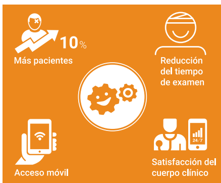
Flujo de trabajo