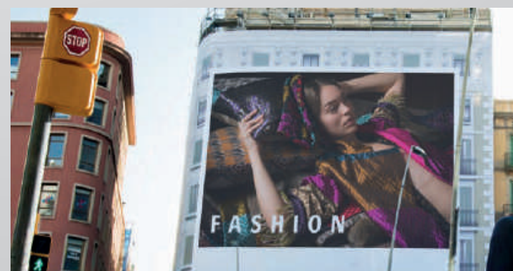
Comunicación exterior – vinilo