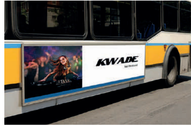
Comunicación exterior – vinilo

Al tratarse de una impresora altamente avanzada suministrada por Asanti, las Anapurna LEDs se integran perfectamente con PrintSphere, un servicio basado en la nube para la automatización de producción, intercambio de archivos sencillo y almacenamiento de datos seguro de Agfa Graphics. Este servicio en la nube integrable proporciona una forma estandarizada para que los proveedores de servicios de impresión automaticen su flujo de trabajo y se facilite el intercambio de datos con clientes, colegas, trabajadores independientes, otros departamentos y otras soluciones de Agfa.