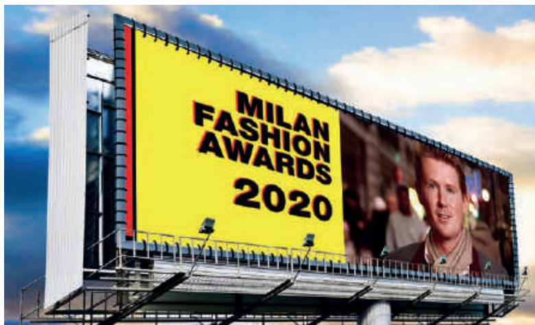
Comunicación exterior – vinilo