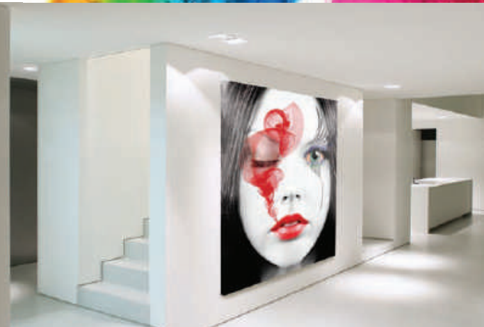
Decoración de interior – dibond