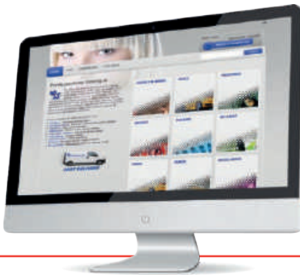
StoreFront web-to-print software

StoreFront es un servicio web-to-print integral diseñado para manejar los pedidos entrantes desde Internet. El procesamiento de pagos y la preparación de impresiones sin errores automatizados aseguran que los nuevos trabajos estén listos para imprimir en poco tiempo y con una mínima intervención del operador.