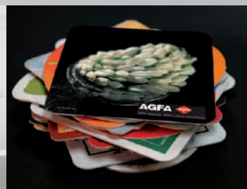
Impresión de objetos – cartón