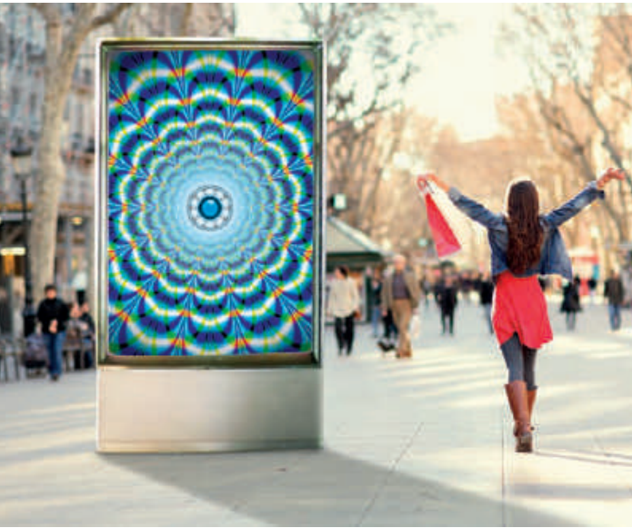
Outstanding print quality on backlit applications

La serie i híbrida de Anapurna con curado LED de gran formato es adecuada para talleres de cartelería, impresores digitales, laboratorios fotográficos e impresores serigráficos medianos que desean combinar trabajos de impresión de rígido y de rollo a rollo. Los equipos de 6 colores imprimen a un ancho de hasta 3,2 m y combinan alta calidad con gran productividad para trabajos, en interiores y exteriores. La Anapurna híbrida está equipada con lámparas LED UV, lo que le permite imprimir en una mayor combinación de materiales y ahorrar energía, costes y tiempo. La función de tinta blanca crea posibilidades para la impresión sobre material transparente para aplicaciones con retroiluminación o para imprimir el blanco como color directo. Con el alimentador de rígidos opcional automatizado, la productividad es aún mayor.