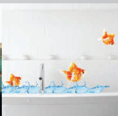
Impresión en azulejo