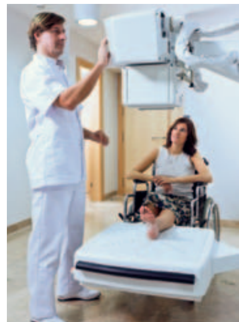
DX-D 300. La forma rápida y fácil de pasar a un sistema de imagen digital.